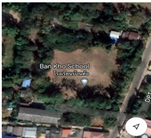
พื้นที่โรงเรียนบ้านค้อ